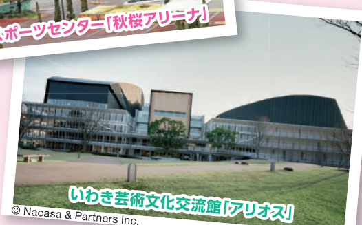
いわき芸術文化交流館「アリオス」