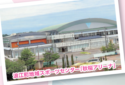
浪江町地域スポーツセンター「秋桜アリーナ」